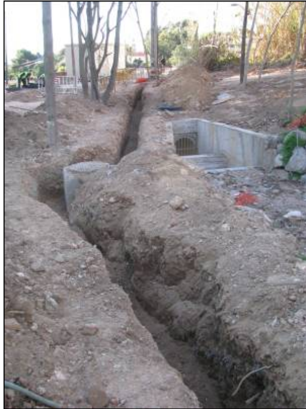
Rasa oberta al camí de la Mare de Déu de Lorda. S'aprecia com s'esquiva el servei de clavegueram. A la dreta estructures de canalització del torrent.