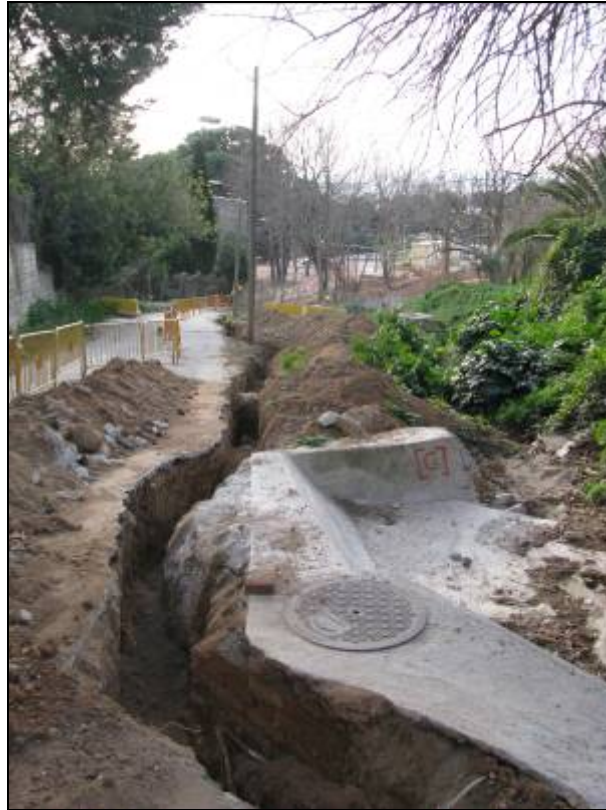
Rasa oberta al tram alt del camí de la Mare de Déu de Lorda. A la dreta estructura de canalització del torrent.