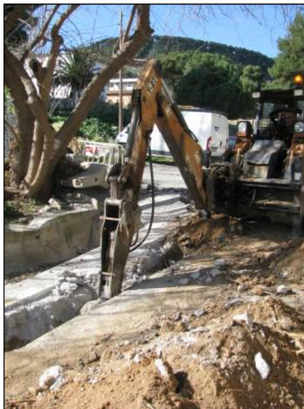
Rasa oberta al tram alt del camí de la Mare de Déu de Lorda. Repicat del formigó de3 la canalització del torrent.