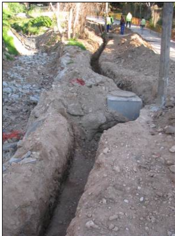
Rasa oberta al camí de la Mare de Déu de Lorda. S'aprecia com s'esquiva el servei de clavegueram. A l'esquerra, el torrent semicanalitzat.