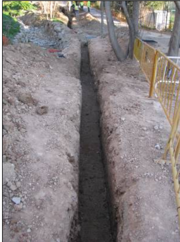
Rasa oberta al tram de la confluència del carrer Montevideo amb Mare de Déu de Lorda.