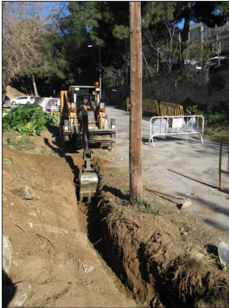
Obertura de la rasa al tram del camí de la Mare de Déu de Lorda.