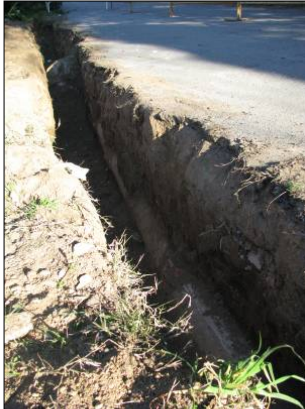
Rasa oberta al tram alt del camí de la Mare de Déu de Lorda. Aparició del clavegueram actual.