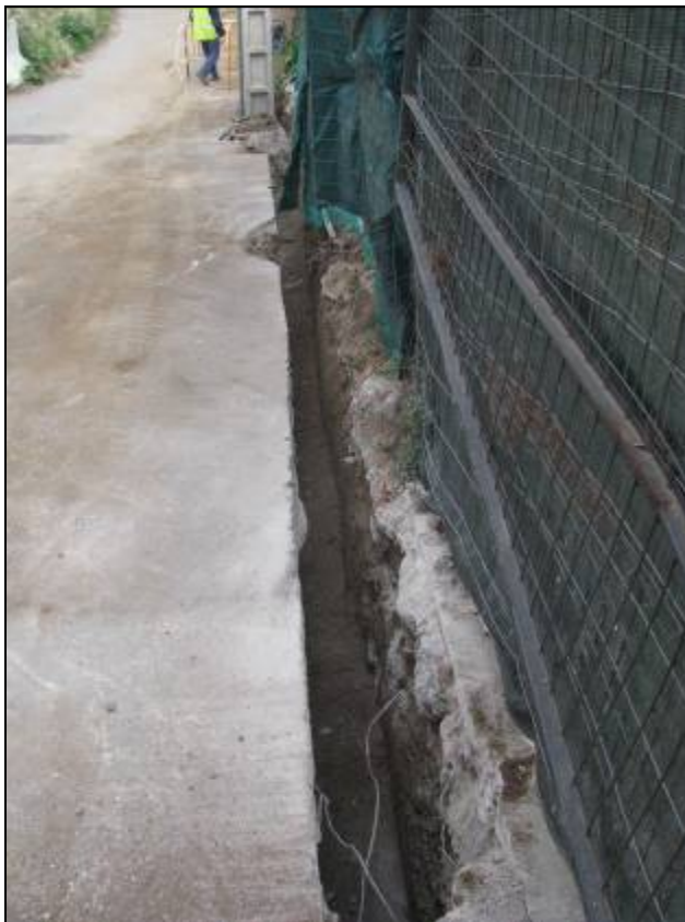
Tram final a la confluència Mare de Déu de Lorda – Conrad Xalabarder.