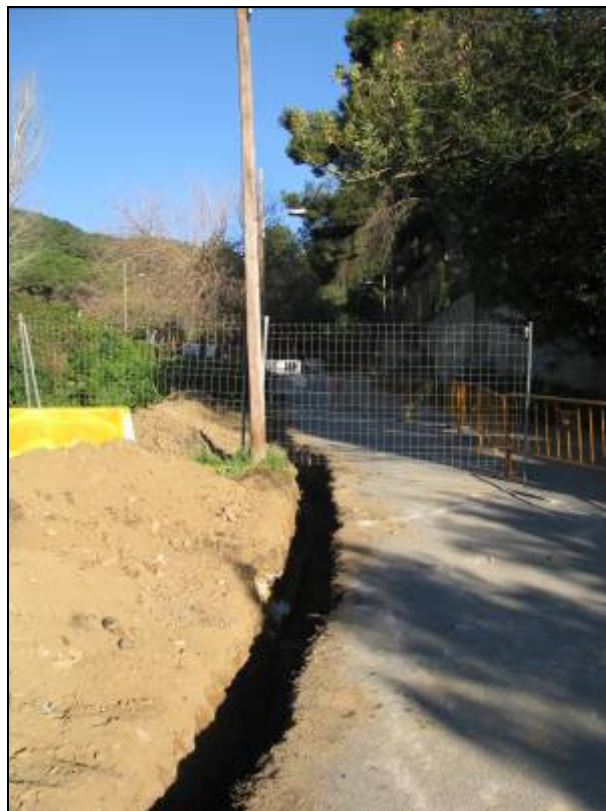
Rasa oberta al tram alt del camí de la Mare de Déu de Lorda.