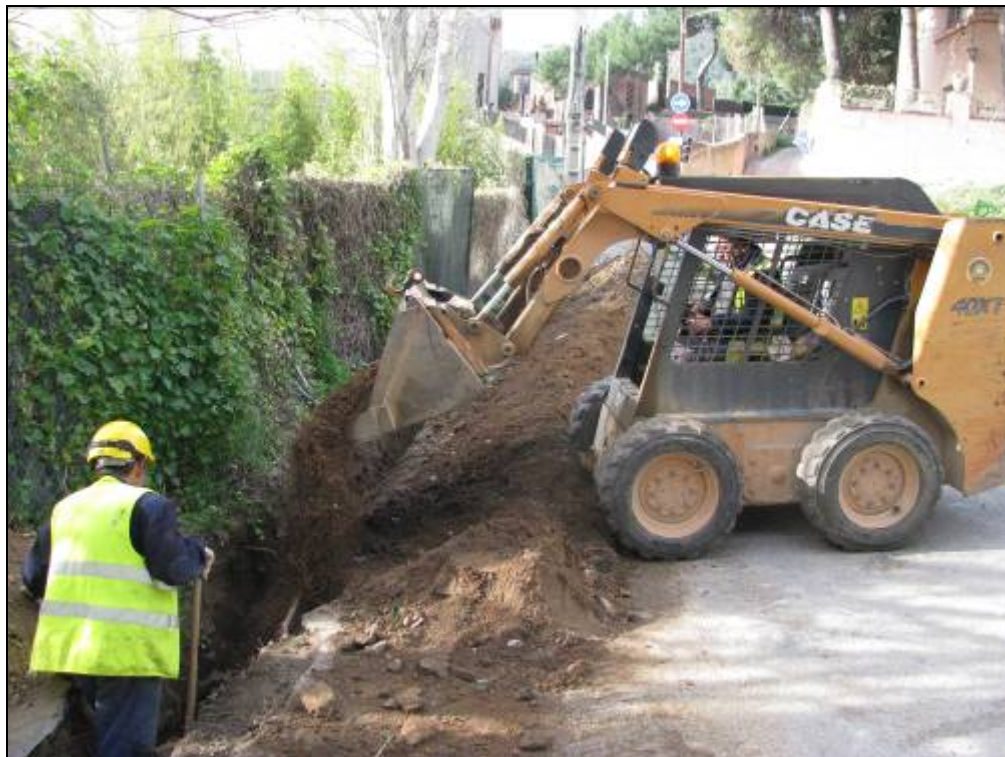
Cobriments de la rasa un cop instal·lat el tub.