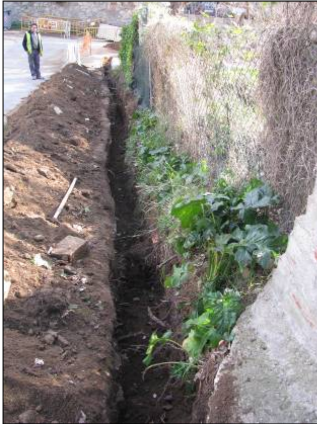
Rasa oberta al tram Mare de Déu de Lorda – Conrad Xalabarder.