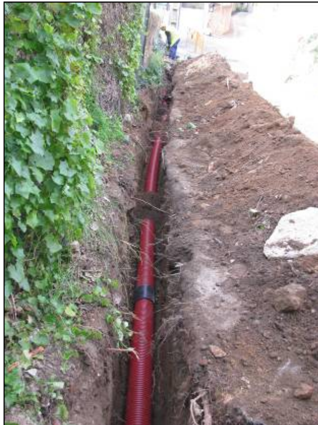
Instal·lació del tub per cablejat elèctric.