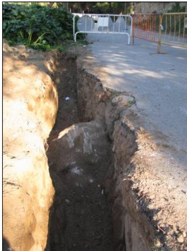
Rasa oberta al tram alt del camí de la Mare de Déu de Lorda. Aflorament de granit.