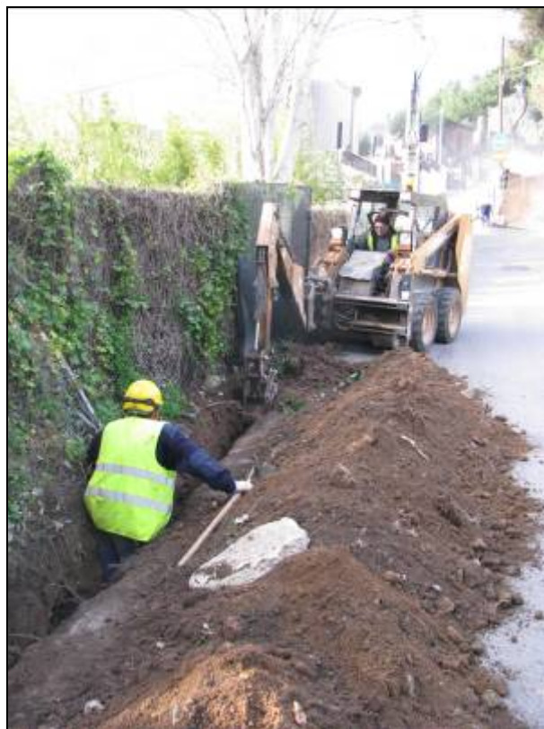
Obertura del tram Mare de Déu de Lorda – Conrad Xalabarder.