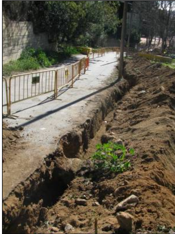
Rasa oberta al tram alt del camí de la Mare de Déu de Lorda.